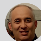
TRANSPORTS SALVA Usuari del servei Trailer Med Xpress

« L'interès d'aquesta línia per nosaltres és que ens aporta una solució per anar més lluny, a Alemanya, per estalviar combustible i per compensar la manca de conductors. »