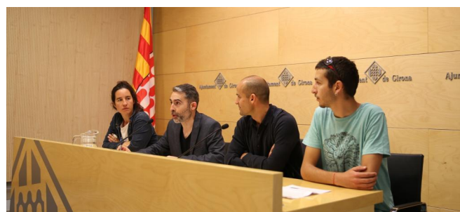
Un moment de la presentació. Aj de Girona

Girona reivindicarà el seu patrimoni fluvial amb la primera edició de l'Aplec dels 4 Rius, que tindrà lloc a la ciutat els dies 8 i 9 de juny. El parc de les Ribes del Ter serà l'escenari d'aquesta festa de la natura organitzada per l'Associació Naturalistes de Girona i l'Associació La Sorellona i que compta amb la col·laboració de l' Ajuntament de Girona i del Consorci del Ter.