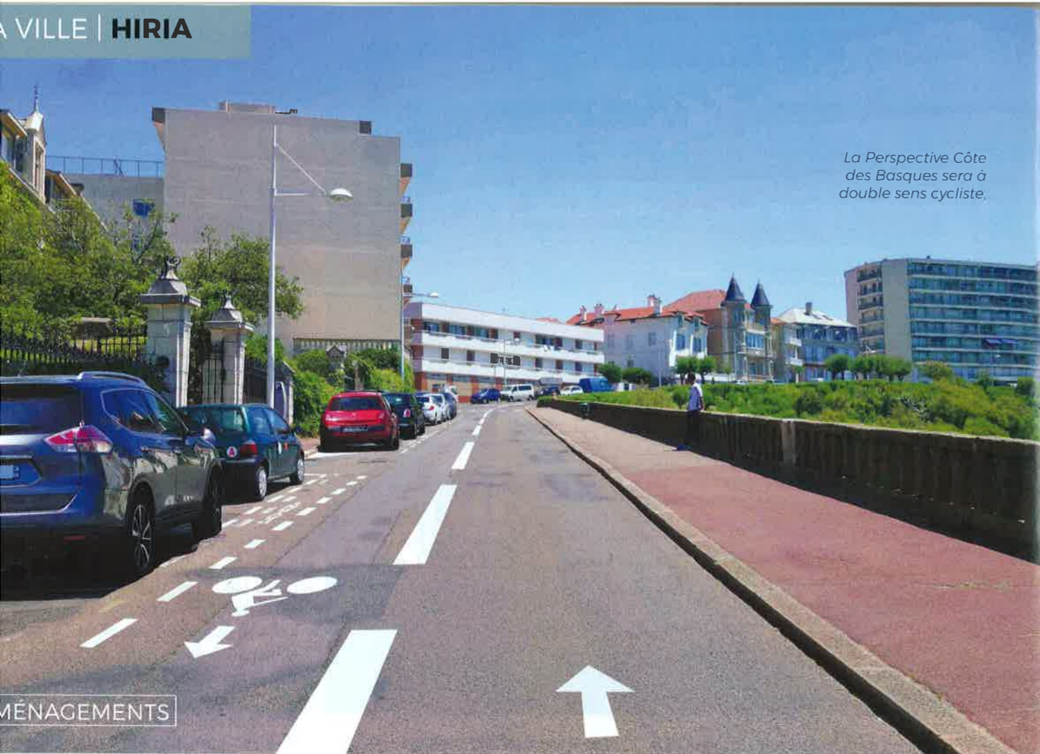
La Perspective Côte des Basques sera à double sens cycliste.