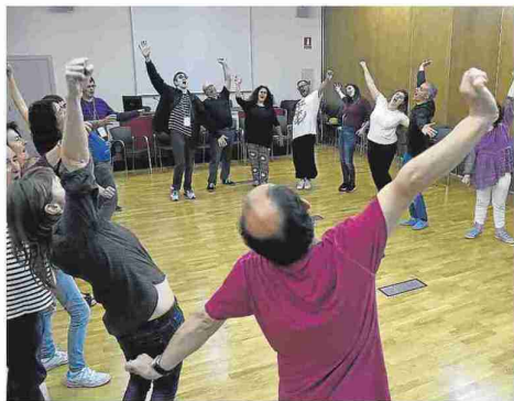
Los talleres enmarcados en Diversario cuenta con una nutrida participación de público.